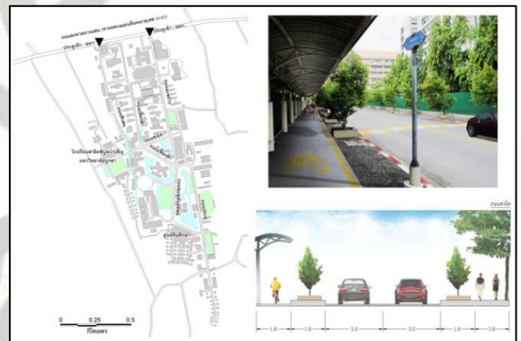
มหาวิทยาลัยบูรพา