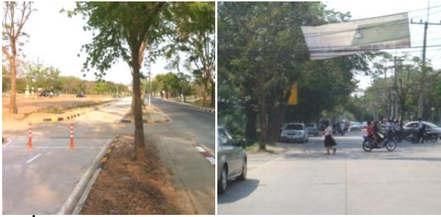
รูปที่ 2: ตัวอย่างปัญหาและอุปสรรคการใช้จักรยานในการเดินทางในมหาวิทยาลัย

ข้อเสนอแนะแนวทางการส่งเสริมการใช้จักรยานภายในมหาวิทยาลัยเกษตรศาสตร์ มหาวิทยาลัยศิลปากร และมหาวิทยาลัยธรรมศาสตร์ จึงแบ่งออกเป็น 2 ส่วน คือ 1) แนวทางการส่งเสริมทางด้านกายภาพ ได้แก่ การจัดทำทางจักรยานให้มีความครอบคลุมและชัดเจนมากขึ้น การปรับปรุงเส้นทางถนนและทางจักรยานที่มีอยู่แล้ว การปรับปรุงและพัฒนาจุดจอดรถจักรยานที่มีอยู่แล้ว และ 2) แนวทางการส่งเสริมทางด้านนโยบาย ได้แก่