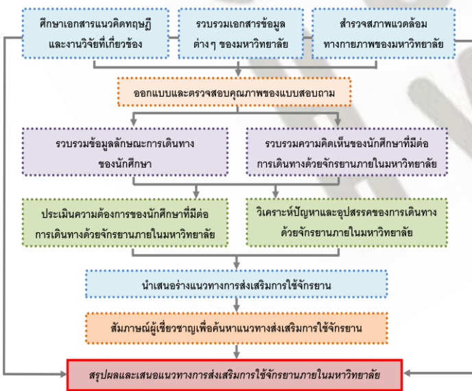
รูปที่ 1: วิธีการวิจัย